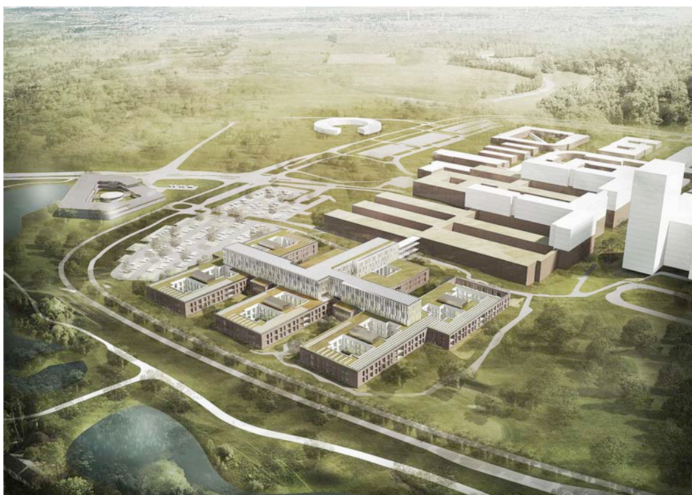
Det kommende Nyt Psykiatrisk Center, AUH, Skejby. Luftperspektiv, set fra sydvest.

Centeret realiseres som et OPP-projekt af Team KPC i et konsortium bestående af KPC Herning A/S, Pensionskassernes Administration (PKA), Lærernes Pension Ejendomsselskab (Lærernes Pension) samt følgende underrådgivere: Arkitema K/S, Grontmij A/S og Wicotec Kirkebjerg. Parterne skal sammen bygge det center, der i 2019 skal erstatte det gamle psykiatriske hospital i Risskov.